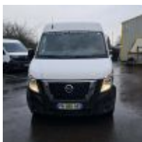
Lot n° 14 NV400 - NISSAN