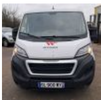
Lot n° 14.2 BOXER - PEUGEOT