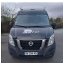
Lot n° 13.3 INTERSTAR NV400 - NISSAN