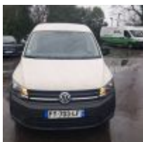
Lot n° 15 CADDY - VOLKSWAGEN