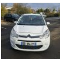
Lot n° 16 C3 1.0 PTEC - CITROEN