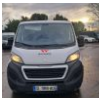
Lot n° 14.1 BOXER FOURGON PREMIUM 330 L1H1 BLUEHDI 120 - PEUGEOT